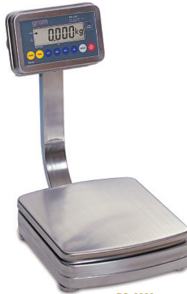
PS-6000 PS-15K PS-30K