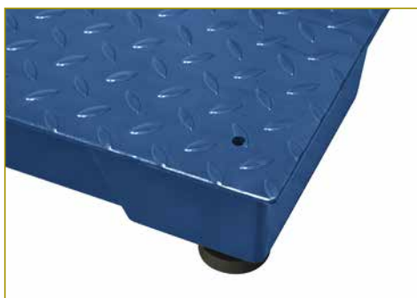
Esquinas reforzadas Alta resistencia a los golpes.