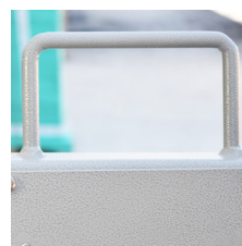
Asa de fácil transporte