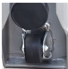
Ruedas de transporte